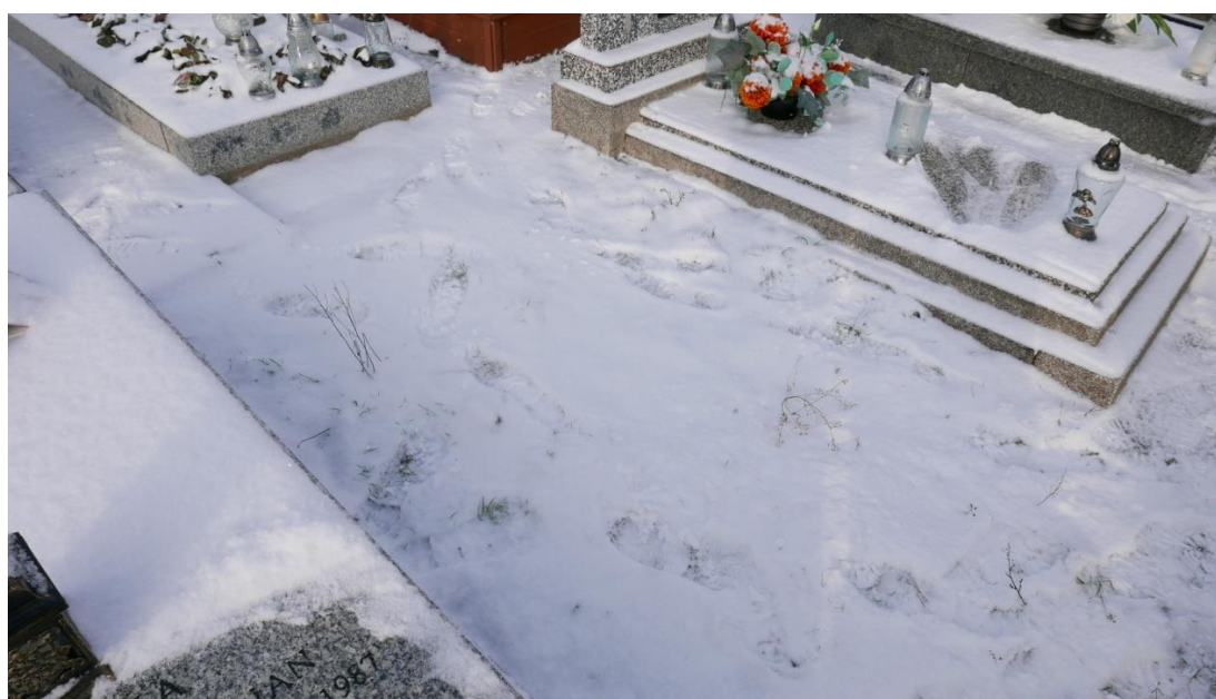
Miejsce po zlikwidowanym nagrobku na mogile Stefana Grzelczyka – stan na 13 grudnia 2022 r.