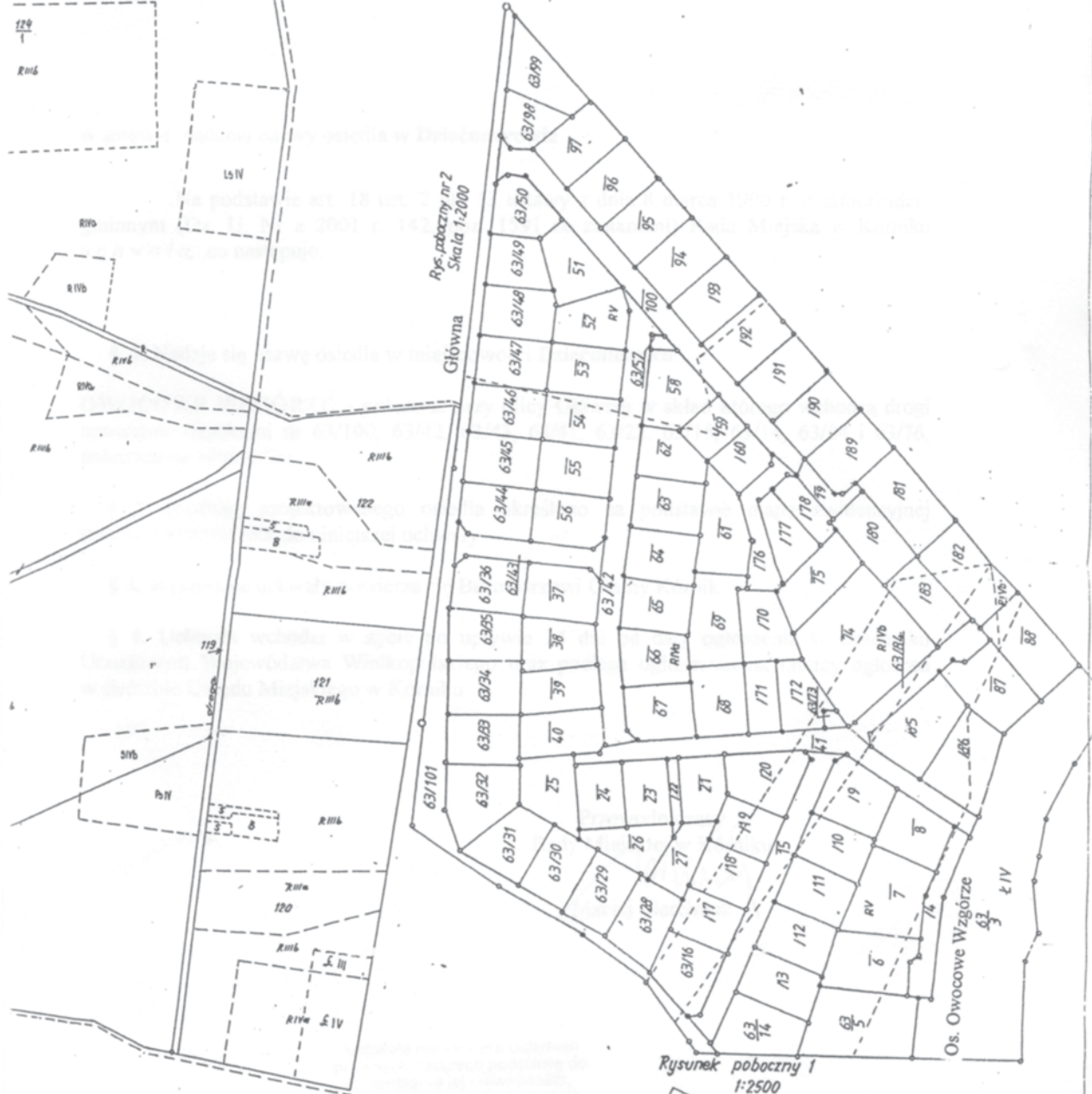
Rysunek poboczny 1 1:2500