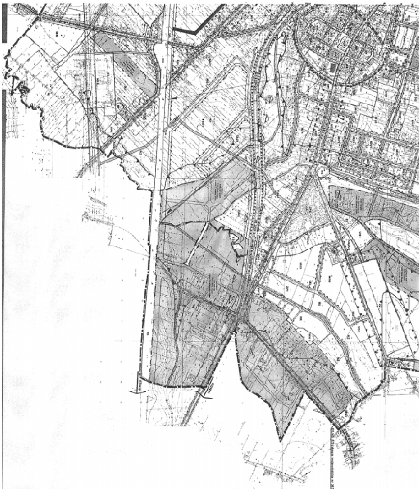
MIEJSCOWY PLAN ZAGOSPODAROWANIA PRZESTRZENNEGO DLA MIASTA SŁUPCY - CZĘŚĆ A - ARKUSZ 4/4