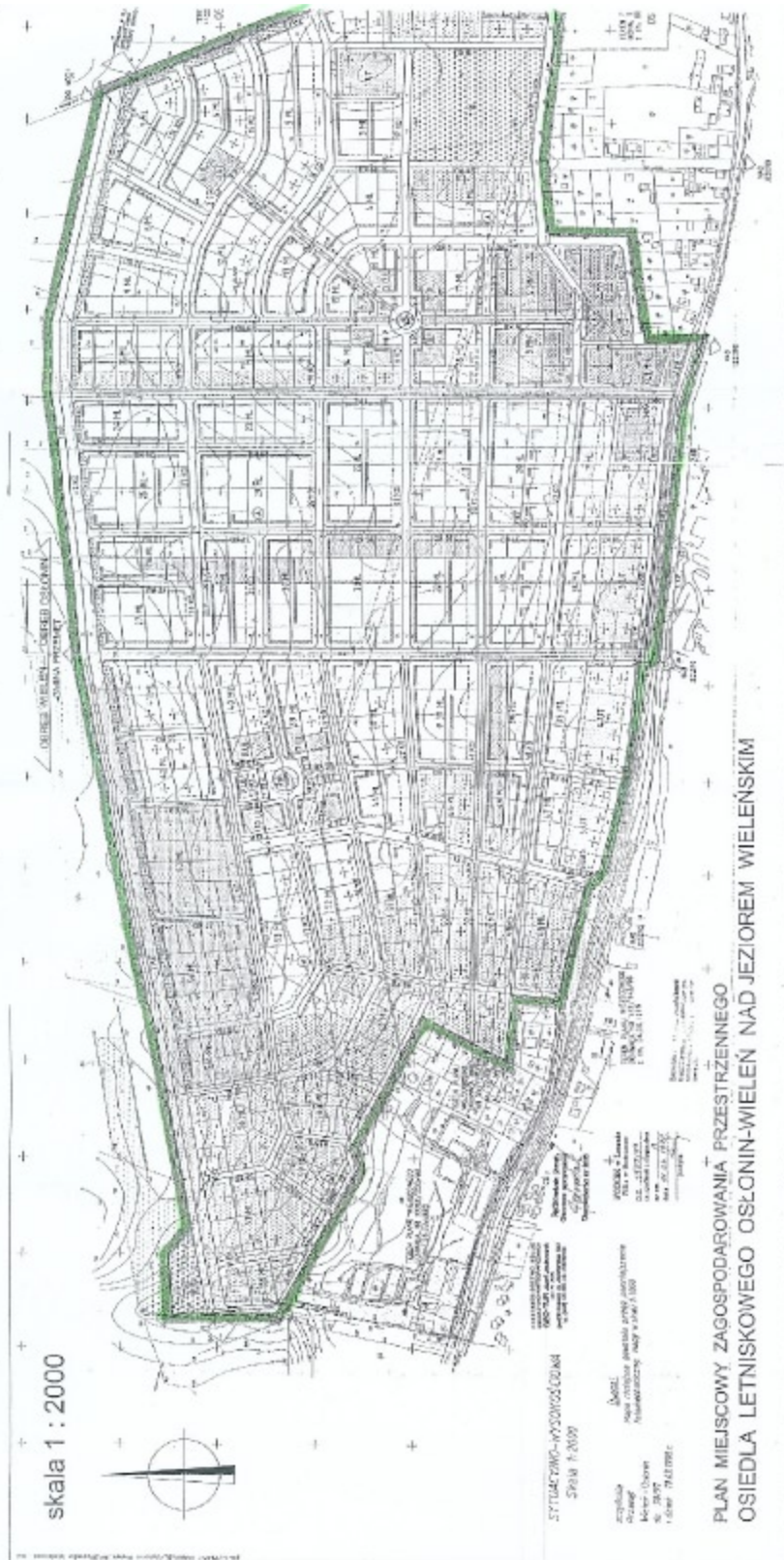
Rysunek planu miejscowego zagospodarowania przestrzennego osiedla letniskowego Ostolin – Wieleń – załącznik graficzny nr 6