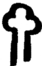
Rysunek 3 Logo Szlaku Cysterskiego

Wśród najważniejszych atrakcji na trasie szlaku