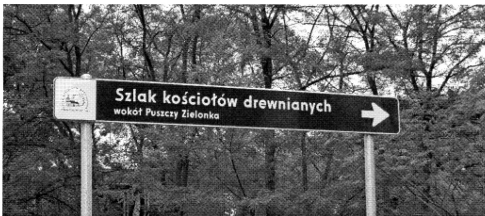
Rysunek 2 Oznakowanie drogowe Szlaku kościołów drewnianych wokół Puszczy Zielonka” ( fort. K. Stefaniak )

3.5.3. Cysterski Szlak Rowerowy po Północnej