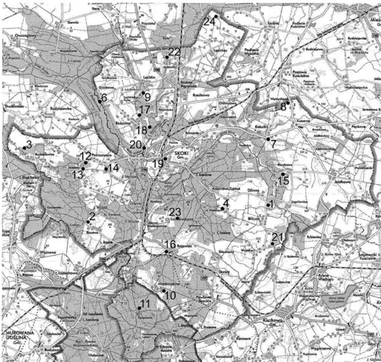
Rysunek 5 Mapa przedstawiająca lokalizację cmentarzy na terenie Gminy Skoki.

5.5. Uwarunkowania wewnętrzne wynikające z dokumentów gminnych