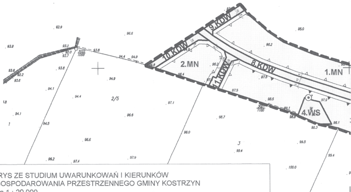
WYRYS ZE STUDIUM UWARUNKOWAŃ I KIERUNKÓW ZAGOSPODAROWANIA PRZESTRZENNEGO GMINY KOSTRZYŃ skala 1 : 20 000